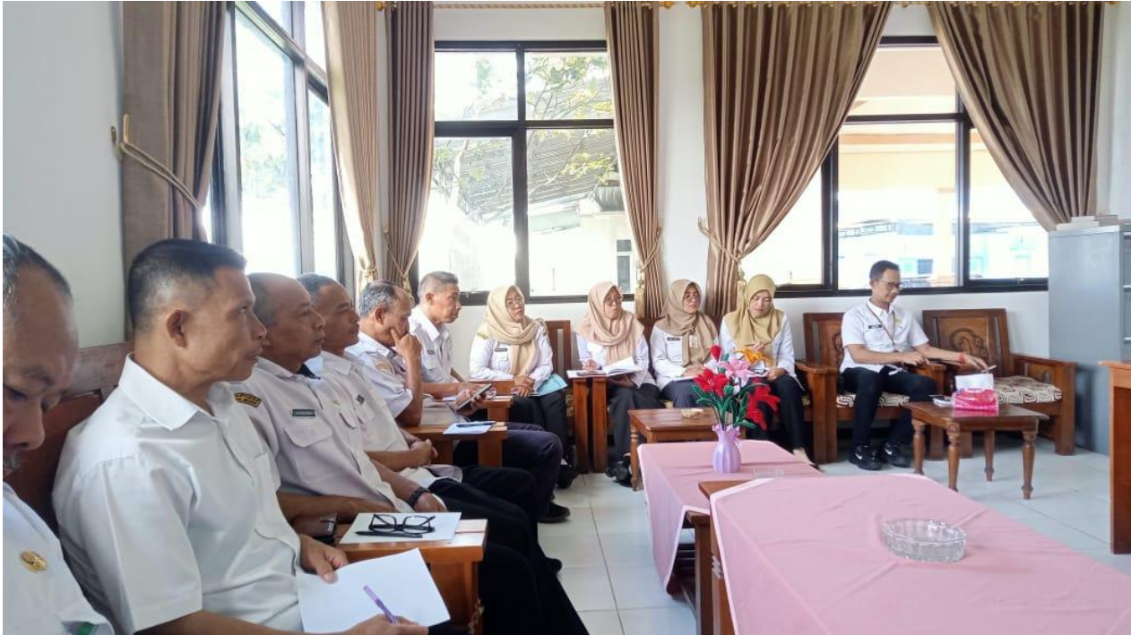
FOTO DOKUMEN RAPAT